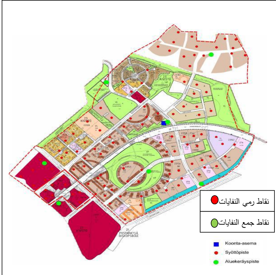
(شكل-3) مخطط مدينة (Vantaa Kivistö) وتظهر فيها مواقع رمي وجمع النفايات في المدينة

www.famad.fr/sites/make-ai/-upload-/3432_12745_20140417183153.pdf