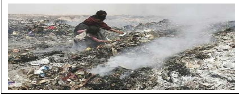
(شكل-6) مكبات النفايات المفتوحة في العراق و عملية الحرق العشوائية الملوثة للجو والتربة

تمتلك دول العالم المتقدم تاريخاً طويلاً في الاستفادة من النفايات كمصدر لانتاج الطاقة ففي السويد انشأت اول محطة لانتاج الطاقة عن طريق حرق النفايات عام (1904)، وبعد انتهاء الحرب العالمية الثانية وسعت السويد استخدام النفايات كمصدر لانتاج الطاقة الحرارية للتدفئة. حيث ارتفعت نسبة الطاقة المنتجة من المصادر المتجددة بما فيها النفايات من (10%) عام (1985) الى نسبة (22%) عام (1996) من مجمل الطاقة المستخدمة في السويد و هي تسعى لايصال هذه النسبة الى (50%) بحلول عام (2020). اشارت التقارير الى ان النفايات جهزت السويد بطاقة تشكل (32%) من مجمل الطاقة المستهلكة فيها عام (2010) حيث تم حرق ما يقارب خمسة ملايين طن من النفايات خلال ذلك العام.