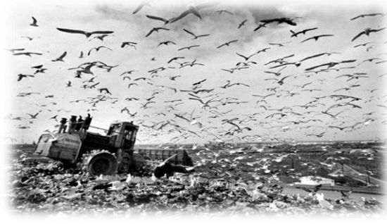
مكب النفايات (Fresh kills) في الولايات المتحدة