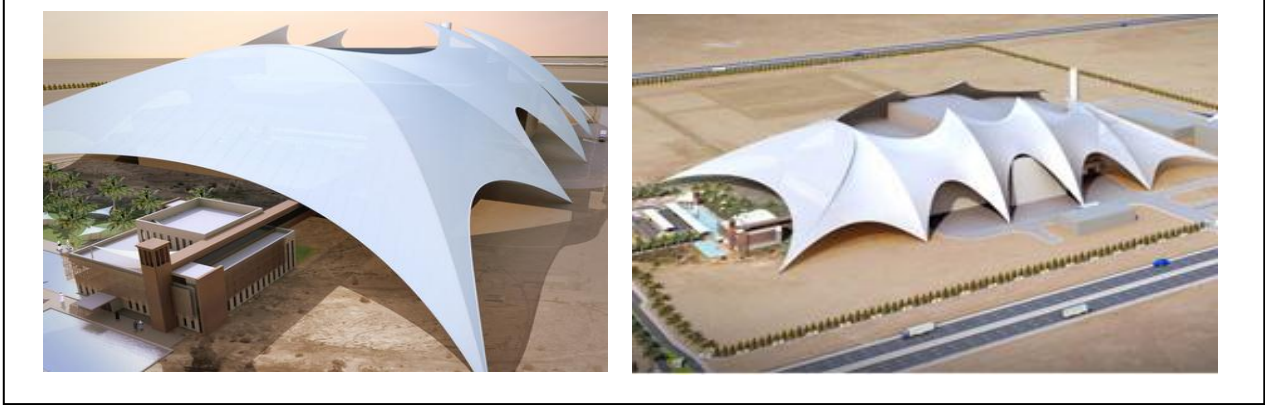
(شكل-8) محطة ابو ظبي لانتاج الطاقة من النفايات http://www.gsda.co.uk

كما سعت الإمارات العربية المتحدة لإنشاء محطة لإنتاج الطاقة من النفايات و التي ستستهلك مليون طن من النفايات سنوياً و تمنع انبعاث ما مقداره (1.5) مليون طن من غاز ثاني اوكسيد الكربون إلى الجو و ستزود (20) ألف عائلة بالكهرباء عبر إنتاجها (100) ميغا واط من الطاقة الكهربائية (شكل-8). ( www.ramboll.com/projects/re/waste-to-energy-facility-in-abu-dhabi )