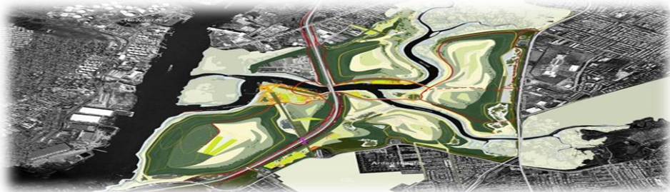
(شكل-13) متنزه (Fresh kills) في الولايات المتحدة