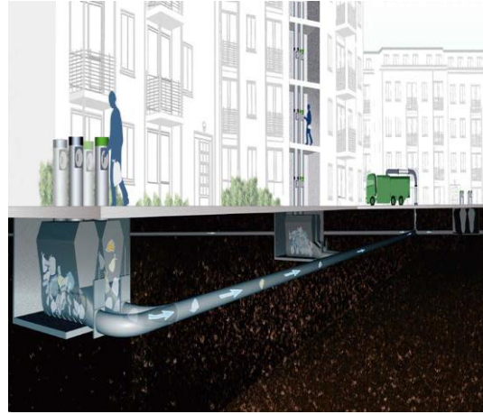
(شكل 5- منظومة شفط النفايات المتحركة)

www.envacgroup.com/storage/cms/.../pdf/.../Movac%20brochure_ENG.pdf