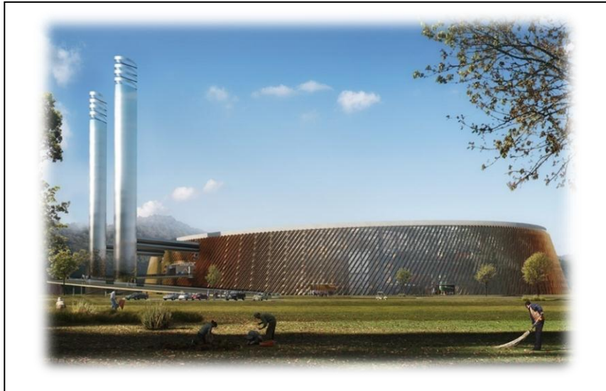
(شكل-9) محطة (Schenzhen) لانتاج الطاقة من النفايات-الصين اكبر محطة في العالم www.fastcoexist.com/.../this-massive-waste-to-energy-plant-will-be-t .

وتخطط الصين لبناء محطة (Schenzhen) التي ستستهلك (5000) طن من النفايات يومياً وستكون واحدة من (300) محطة سيتم بنائها في المستقبل. ما يميز المشروع فضلاً عن ضخامته هو وجود ممر للزوار يمر حول مكونات المحطة لشرح كل مرحلة من مراحل العمل في المحطة و بذلك لتكون نموذجاً تعليمياً للأشخاص. كما ان المحطة ستزود بسقف مغطى بخلايا شمسية بمساحة (44) الف متر مربع لتوفير الطاقة الكهربائية فضلاً عن وجود سقوف خضراء و مناطق لمعالجة مياه الأمطار على السقف (شكل-9). www.fastcoexist.com/.../this-massive-waste-to-energy-plant-will-be-t .