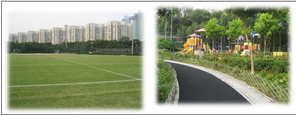
(شكل-12) متنزه (Sai Tso Wan) اول متنزه في هونج كونج يتحول من مكب نفايات الى متنزه

اما في هونج كونج فان اول مكب نفايات تم تحويله الى متنزه متعدد الاغراض هو متنزه (Sai Tso Wan) حيث تم عزل النفايات عن التربة الجديدة الخاصة بالمتنزه بشكل محكم وفي الموقع الجديد تم انشاء متنزه يضم ملاعب و ساحات رياضية و معسكرات للتخييم مما اعطى اهمية اكبر للمنطقة التي انشأ فيها و ضاعف اقبال الناس على السكن في تلك المنطقة بعدما كانت منطقة متروكة و غير مرغوب فيها بل اصبح المتنزه الشعار الرسمي للحركة الخضراء في هونج كوج (شكل-12) A. P. Rijs. ,2007,p.20